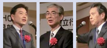
橋本会長 宮平会長 中村会長

その後の歓談では、積極的な意見交換が行われ、会場が狭かったということもありますが、とても熱意を感じる活気に溢れた会となりました。