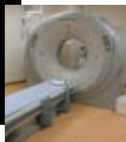
16列マルチスライスCT